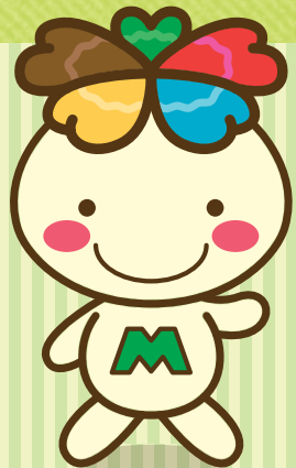
JA東京みどり キャラクター みーどりん